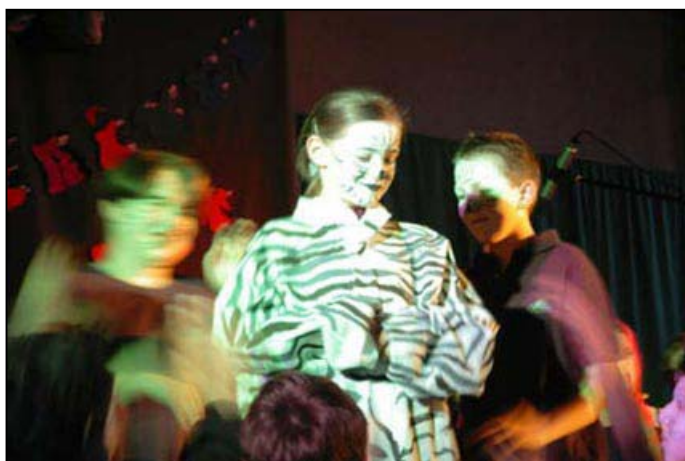
Bild 3: Findus und seine Katze aus dem Musical *Tierisch gut...*, 2002