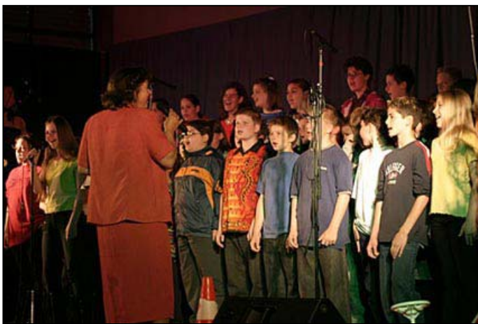
Bild 12: Unterstufenchor aus der Performance „On the Road...“, 2004