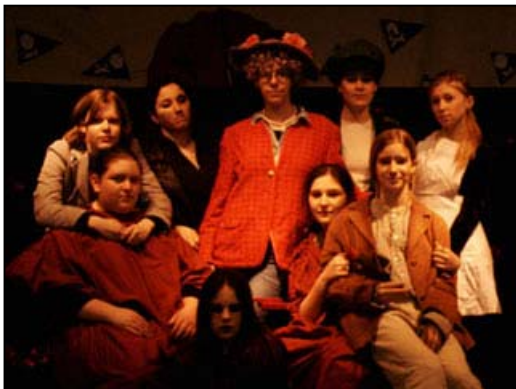
Bild 6: Szene aus dem Theaterstück „Liebe, Rohseide und Wellblech“, 2002