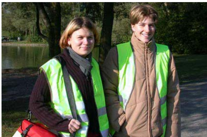
Bild 1: Mitglieder des Schulsanitätsdienst beim Sponsorenlauf 2002 in der Rheinaue