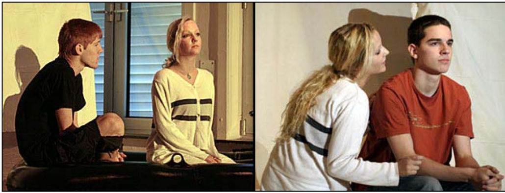
Bild 14: Szenen aus dem Theaterstück, „Das ertrunkene Land“, 2004